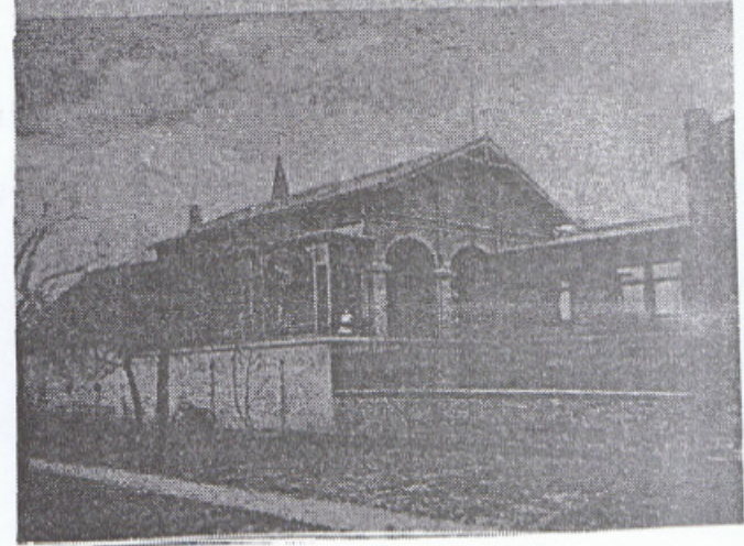
Postkarte von 1919