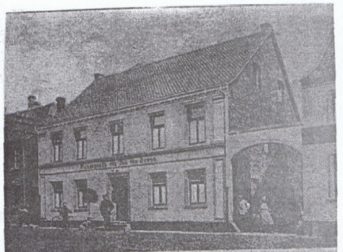
Lenk Weinkellerei von Josef van Daven Söhne