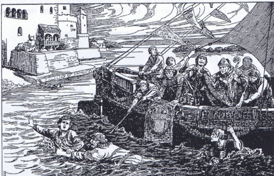
Entführung Heinrichs IV.

Unter Mitwirkung Erzbischofs Anno von Köln wurde der 11-jährige König Heinrich IV. 1062 entführt.